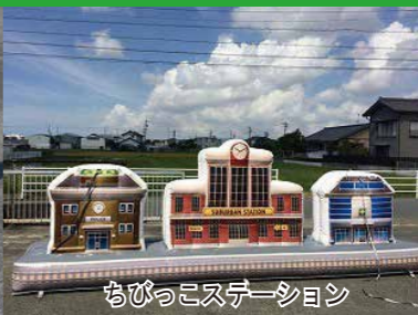
ちびっこステーション