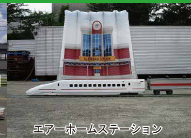
エアホームステーション