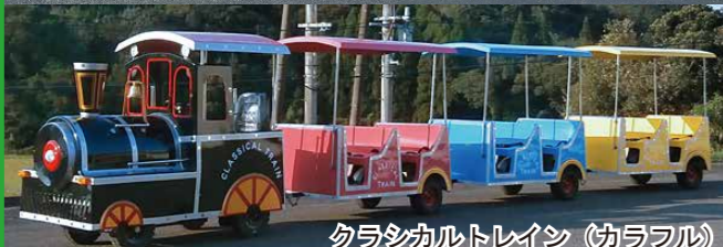
クラシカルトレイン (カラフル)