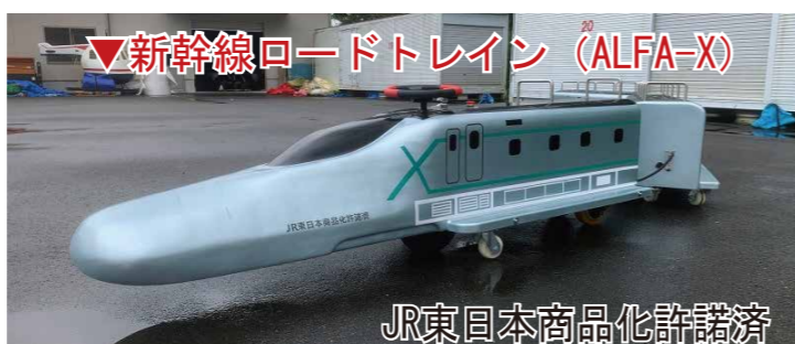
JR東日本商品化許諾済