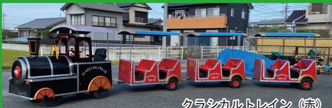
クラシカルトレイン (赤)